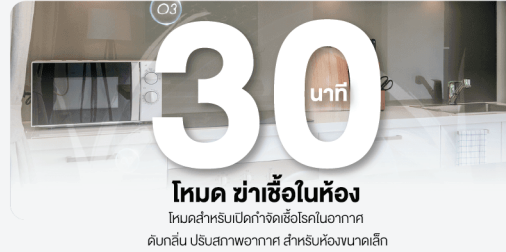
โหมด ขำเชื้อในห้อง โหมดสำหรับเปิดกำจัดเชื้อโรคในอากาศ ดับกลิ่น ปรับสภาพอากาศ สำหรับห้องขนาดเล็ก