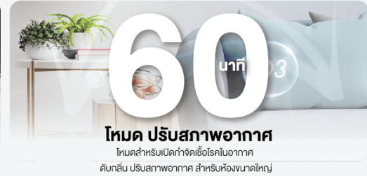
โหมด ปรับสภาพอากาศ โหมดสำหรับเปิดกำจัดเชื้อโรคในอากาศ ดับกลิ่น ปรับสภาพอากาศ สำหรับห้องขนาดใหญ่