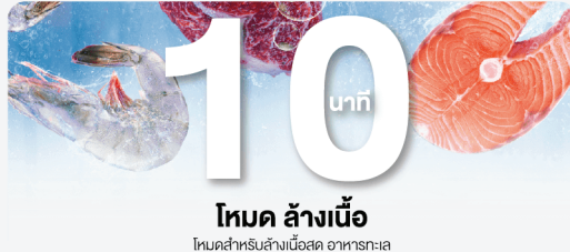
โหมด ล้างเนื้อ โหมดสำหรับล้างเนื้อสด อาหารทะเล