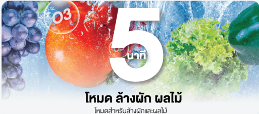
โหมด ล้างผัก ผลไม้ โหมดสำหรับล้างผักและผลไม้